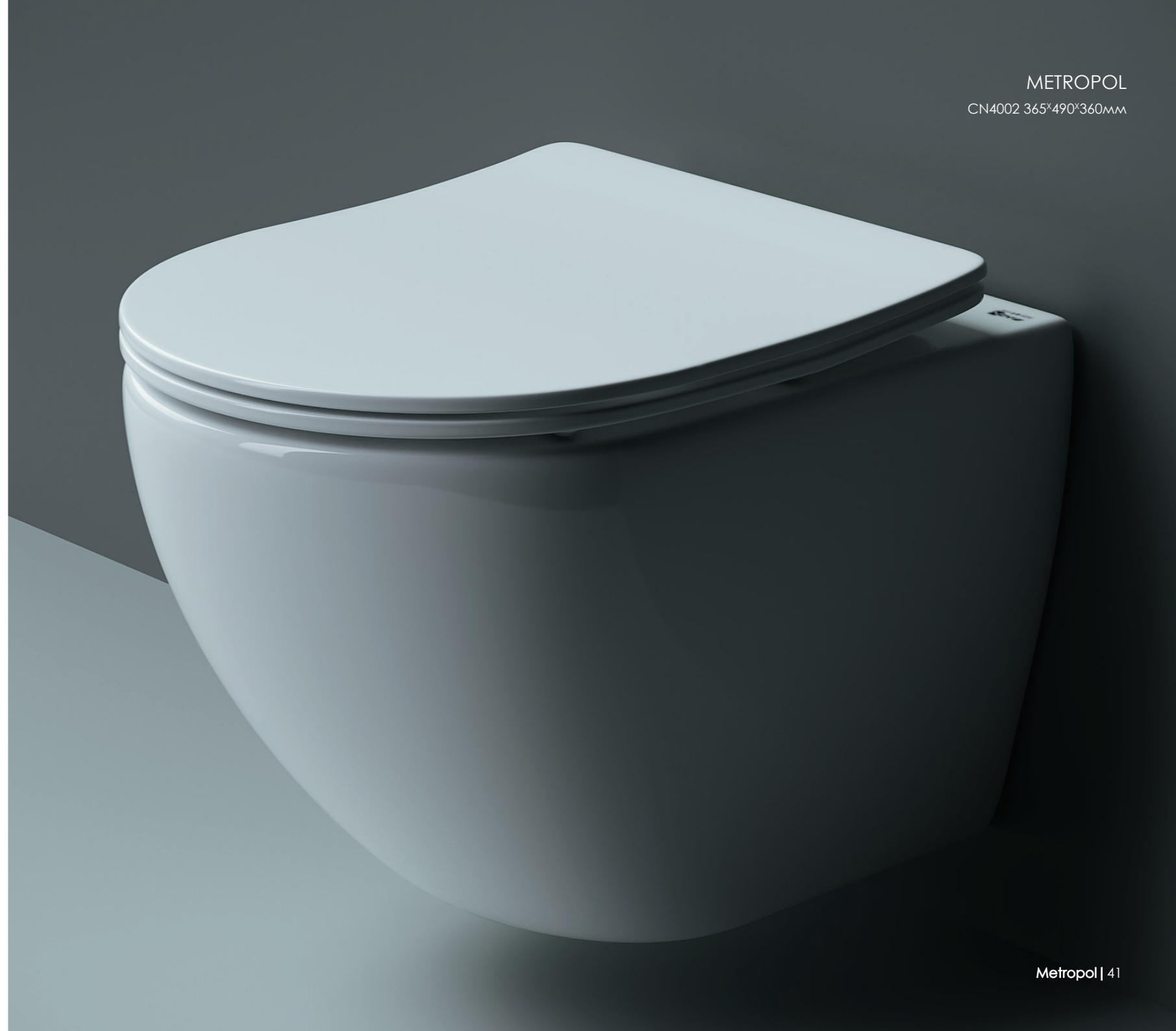
METROPOL CN4002 365*490*360mm