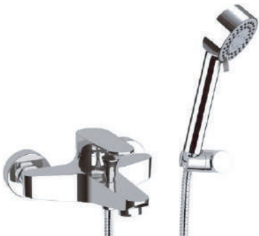
IMMAGINE - IMAGE