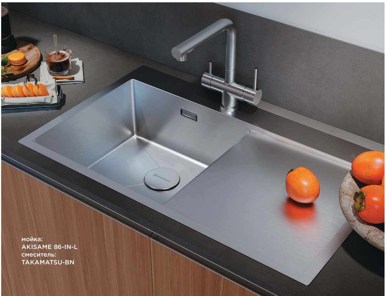
мойка: AKISAME 86-IN-L смеситель: TAKAMATSU-BN