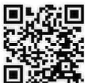
Спецпроект на сайте